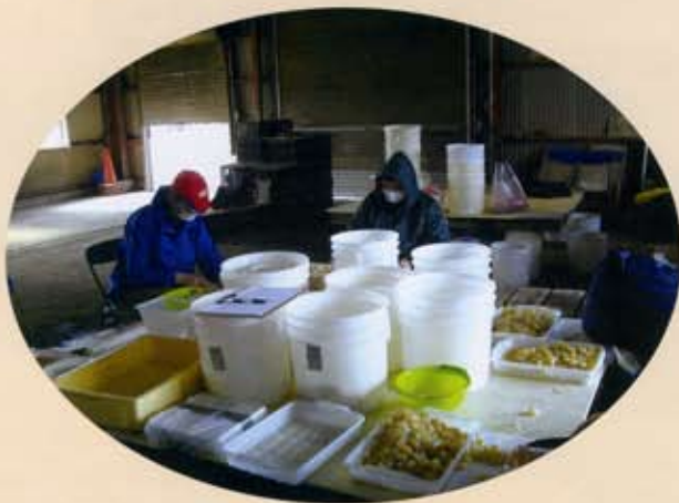
～ 実習風景 ～