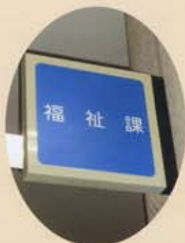
市役所障害福祉課