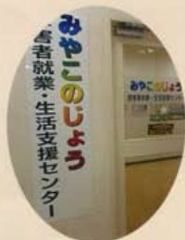
障がい者就業・生活支援センター