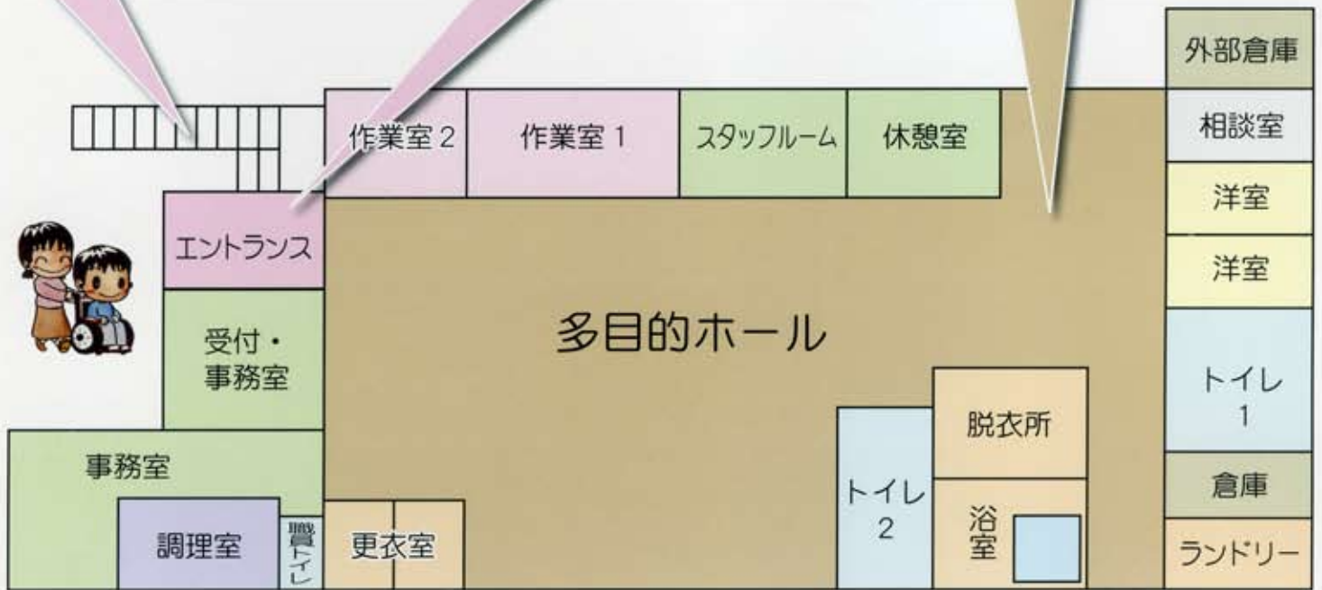
ト イ レ 2