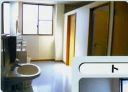
ト イ レ 1