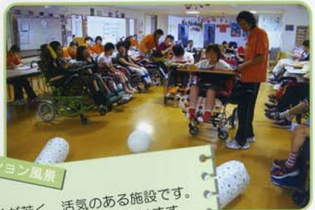
レクリエーション風景